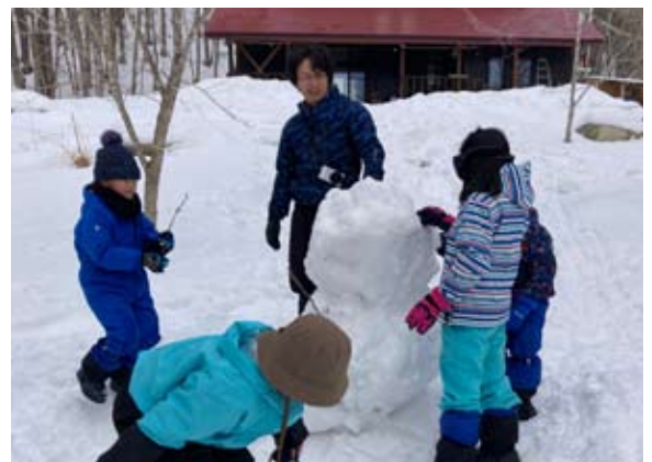
2月のおひさまのねっこは、雪だるまも作りました。

2月のどんぐりのぼうしは、4組の幼児親子11名が参加。この日は木の冬芽の絵本を見てから森歩きへ出発。ヒツジの顔みたいなオニグルミの冬芽を見つけました。また、雪の上では、冬眠中のヤマネを発見！森から戻ると、焚き火で豚汁をつくり、美味しくいただきました。3月のどんぐりのぼうしは、4組の幼児親子10名が参加。森歩きは、ぽかぽか陽気の晴天で、雪が解けの沢水を触ったり、フクジュソウの黄色い花の群落を見たり。道路際に行くとバツケ(フキノトウ)が出ていてバツケ採りもしました。帰って来てからは、昼食づくり。野菜を切って、焚き火でポトフ(野菜スープ)を作って食べました。午後は、イチゴやタマネギの苗を畑に移植作業もできました。