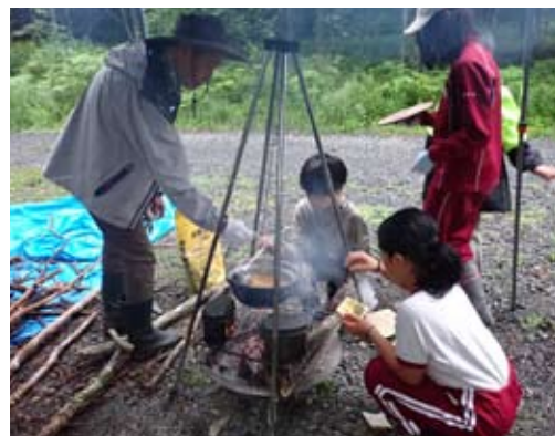
焚き火でつくるご飯は美味しいのです。