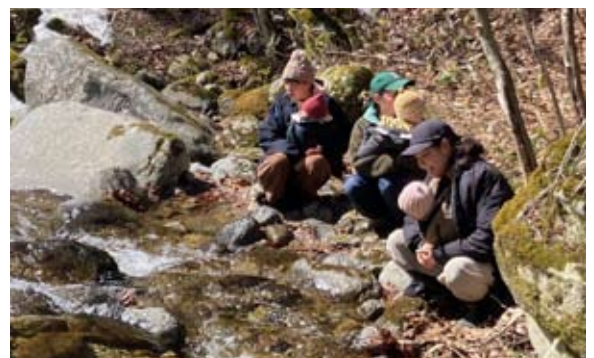
どんぐりのぼうし赤ちゃん編では、川まで行ってみました。

2月のおひさまのねっこは、小学生5名が参加。この日は好天に恵まれ、午前中は森の家周辺で雪遊び。たっぷりの雪が積もっていたので、雪だるまを作ったり、雪合戦、ソリ遊びをしました。その後、森の家の中で、昼食づくり。今回はスパゲッティをみんなで作りました。お昼を食べた後は、雪がたっぷりのオッホーの森に森探検。山の上では、やっぱり雪合戦が人気。森から帰ってからは、焚き火でマシュマロを焼き、クッキーにはさむ「スモア」をおやつに食べました。