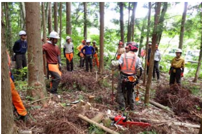
昨年度の山仕事講座の様子。

昨今のシカ・クマの被害や、土石流災害の原因として、里山が放置されていることが指摘されています。また、間伐材を薪にして、薪ストーブや薪ボイラーの燃料として活用できれば、地球温暖化対策に