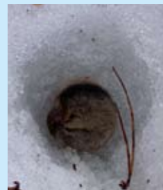
どんぐりのぼうしで冬眠中のヤマメを発見！