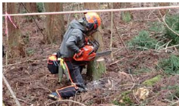
2月の間伐倶楽部では、ほぼ一人でも間伐できてました。

2月と3月の間伐倶楽部はともに3名が参加し、松崎町内の実習林にて杉の間伐・造材を行いました。参加者は、山仕事講座を終了した方達なので、スタッフが手を出さなくても、自分で伐倒方向を決め、ロープや滑車も設置し、安全に間伐が出来る様になりました。