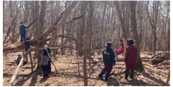
もりっこキャンプ初日は、オッホーのもりへ出かけました。

早春のもりっこキャンプには、小中学生6名が参加。はじめの会を終えたら、お昼のお弁当を持って森探検へ。オッホーの森の奥にあるブナの森まで足を伸ばしました。帰り道は森を抜けて、牧草地へ下ってきました。休憩後は夕食づくり。焚き火で飯ごうのご飯と、鍋でシーフードカレーを作りました。日が暮れた後は、焚き火を囲んでのキャンプファイヤー。マイムマイムやアブラハムを踊りました。その後、牧草地までナイトハイクへ。道路に寝っ転がって、満天の星空を眺めてきました。翌日は、朝食のガレットづくりや、昼食には手作りラーメンにも挑戦しました。午後には、森で拾ったシカのツノを加工して、アクセサリーづくりもしました。