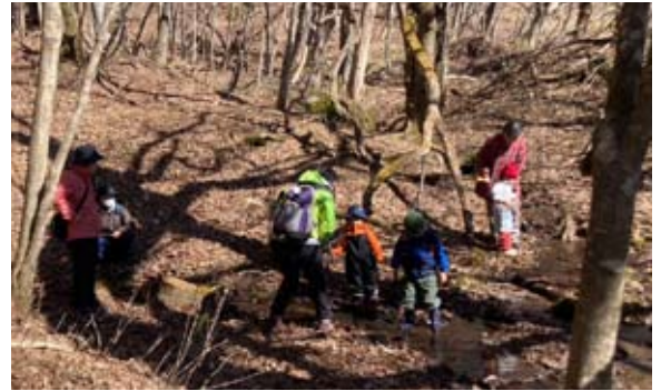
3月のどんぐりのぼうしでは、雪解けの沢水でも遊びました。

今年2回目の満月となるムーンライトハイキングには、スタッフを含め6名が参加。この日は、いつもの牧草地へのコースではなく、森の家の裏に広がるオッホーの森を、スノーシューを靴に装着して歩きました。曇り空でしたが、うっすらと明るい状態で、ライトをつけずに、森の奥へと一歩一歩歩きました。森の広場で休憩後には、帰りの下り坂で、フカフカの雪の斜面をお尻で滑り降りる「ケツゾリ」体験も楽しみました。