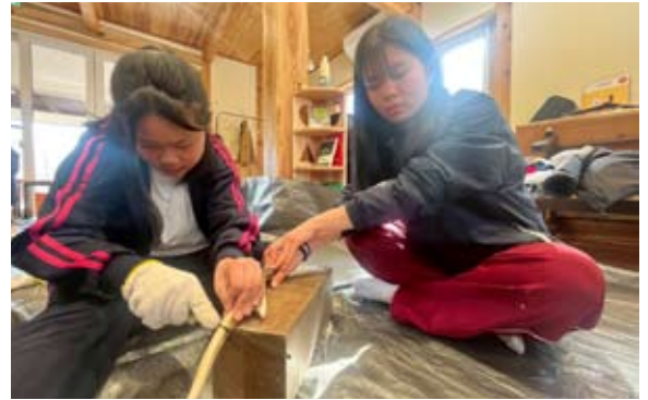
もりっこキャンプ2日目は、シカのツノでクラフトも。