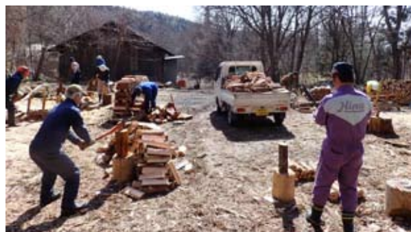
3月の薪づくりは、薪づくりには気持ちのよい天候でした。

2月の薪づくりは小雪が降る寒い天候となりましたが、8名が参加。雪にも負けず、薪づくりをしました。またこの日は森の笠地蔵プロジェクトとして、小友町内の2軒の高齢者宅に軽トラックで各1台分ずつの薪を配達しました。3月の薪づくりは、時折強風が吹き付けるような天気でしたが、県内各地から14名が参加し、薪づくりをしました。また、森の笠地蔵プロジェクトとして、午前中に松崎町内1軒と綾織町内1軒に、午後は音も町内の高齢者宅に軽トラック各2台の薪を配達しました。